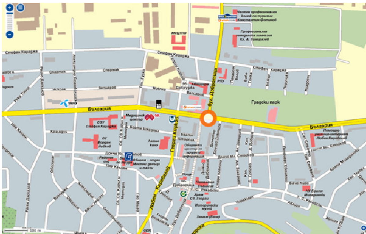
Улична мрежа на Каварна